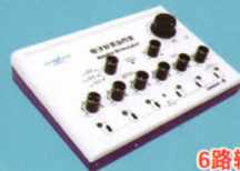
电子针灸治疗仪 (CMNS6-1型)