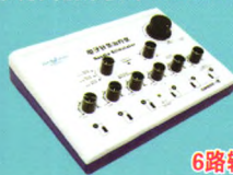
电子针灸治疗仪 (CMNS6-1型)