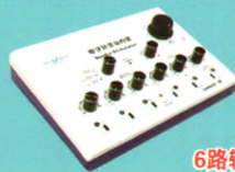
电子针灸治疗仪 (CMNS6-1型)

输出脉冲波形: 非对称双向三角波 脉冲频率: 1~100Hz可调 脉冲宽度: 0.175ms±30% 输出脉冲电路: 二路输出 注册证号: 苏械注准20152270703