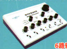
电子针灸治疗仪 (CMNS6-1型)