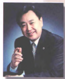
大会主席 中国抗癌协会理事长：樊代明

协办单位：国际抗癌联盟 (UICC) 美中抗癌协会 (USCACA) 中华医学会肿瘤学分会