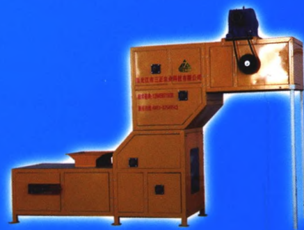
STDL-5.0(10, 15, 20) 系列零破碎提升机