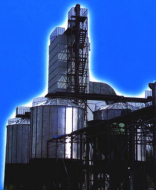
SHHYZ-5.0(10, 15, 20) 系列粮食种子烘干塔

牡丹江绿丰种业（立体型、计算机控制，玉米），黑龙江鑫鑫种业（玉米），吉林宝丰种业（玉米），沈阳博科种业（水稻），甘肃张掖优力盛种业、良润种业（甜、糯玉米），甘肃酒泉千粒农业（葵花籽）、佳木斯浚裕农副土特产品有限公司（南瓜子）、新疆玉丰源种业（半立体，玉米）、新疆博乐金泉种业、新疆伊犁秋丰种业（玉米果穗剥皮、烘干、脱粒，籽粒烘干，精选分级）等。