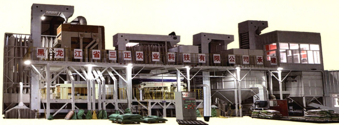
5ZT-5.0(10, 20)型种子加工成套设备

专注种子加工机械 制造精品种机 争创行业品牌 秉承诚信共赢理念 诚信服务全国种业朋友