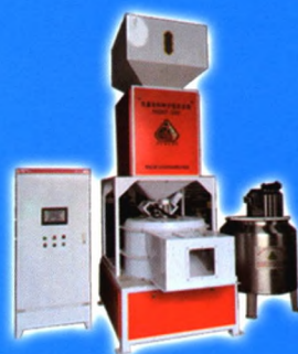
失重给料种子包衣系统 SZBP-100