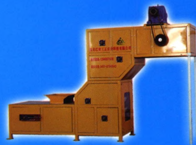
5TDL-5.0(10, 15, 20) 系列零破碎提升机