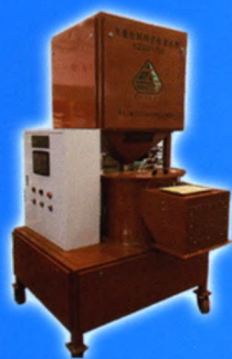
失重给料种子包衣系统 SZBP-50

牡丹江绿丰种业（立体型、计算机控制，玉米），黑龙江鑫鑫种业（玉米），吉林宝丰种业（玉米），沈阳博科种业（水稻），甘肃张掖优力盛种业、良润种业（甜、糯玉米），甘肃酒泉千粒农业（葵花籽），佳木斯浚裕农副土特产品有限公司（南瓜子），新疆玉丰源种业（半立体，玉米），新疆博乐金泉种业、新疆伊犁秋丰种业（玉米果穗剥皮、烘干、脱粒，籽粒烘干，精选分级），赤峰丰田科技种业（高标准玉米种子加工成套设备），赤峰华农种业（高标准玉米种子加工成套设备），吉林新启源农业科技发展有限公司（葵花籽），肇源庄稼人种业（水稻、大豆、玉米），黑龙江省富芷源种业（玉米），黑龙江省梅亚种业（玉米）等。