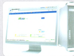
药物信息查询全方案