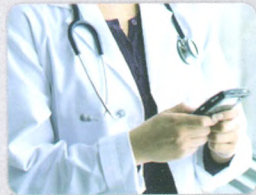
药物信息查询移动方案