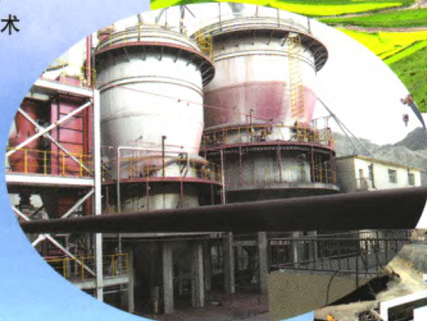
亚洲最大的二段焙烧厂