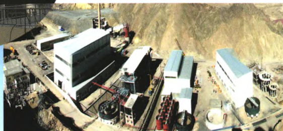
青海滩间山金矿EPCM项目