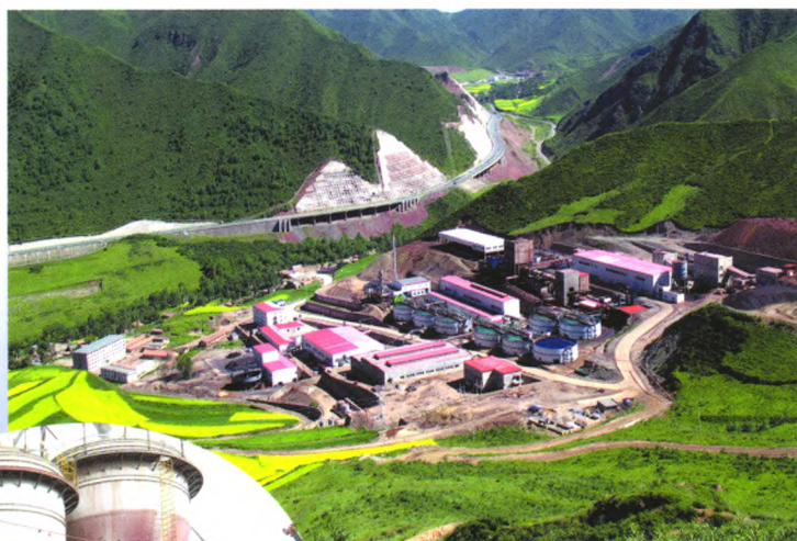
青海元石山镍红土矿还原