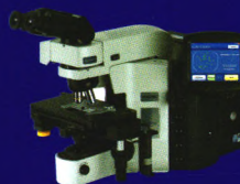
新柏氏 ® 集成影像仪 (I2)