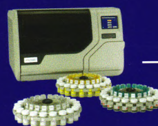
新柏氏 ® 5000 全自动批量制片仪