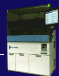
全自动一体化分子检测平台 Panther ® 系统