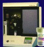
新柏氏 ® 2000 全自动细胞制片机