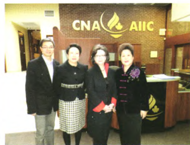
图4 中华护理学会代表参访加拿大护士会