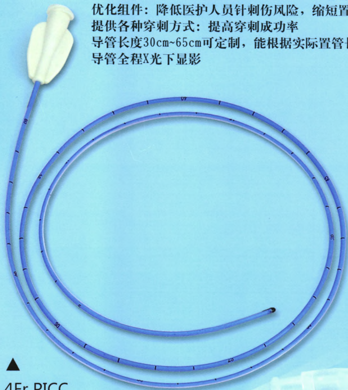
▲ 4Fr PICC

广告批准文号： 粤医械广审（文）第2018010036号 禁忌内容或注意事项详见说明书 注册号：国械注准20153772016