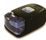
RESmart® 瑞迈特 自动调节持续正压通气治疗机 APAP