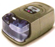
RESmart® 瑞迈特 双水平持续正压呼吸机 BPAP