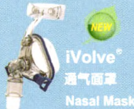
iVolve® 通气面罩 Nasal Mask