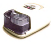
RESmart® 瑞迈特 智能持续正压呼吸机 CPAP