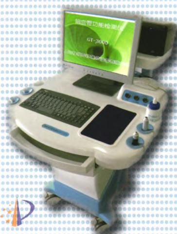
脑血管功能检测仪GT-3000