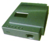
韩国i-CHROMA Reader 免疫荧光分析仪

自动化/信息化/个性化/集成化 实现POCT与中心实验室的完美结合, 确保院内检测结果一致化!