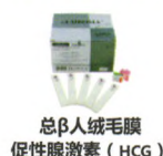
总β人绒毛膜 促性腺激素 (HCG)