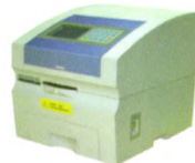
全自动样品处理系统