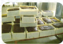
一次干燥出来的中药浸膏