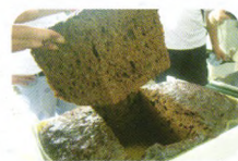
疏松多孔的浸膏容易粉碎