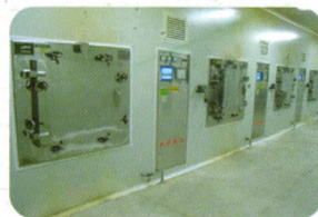
制药企业正在使用的设备