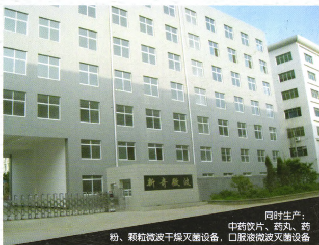
同时生产： 中药饮片、药丸、药粉、颗粒微波干燥灭菌设备，口服液微波灭菌设备