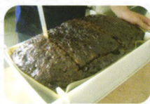
干燥出来的浸膏样