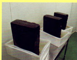
干燥出来的浸膏样