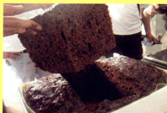
疏松多孔德浸膏容易粉碎