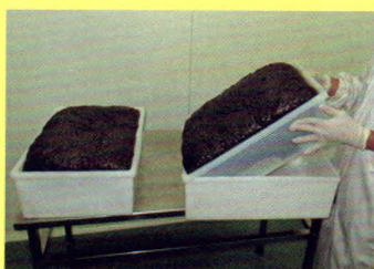
特制的干燥盒取料非常容易