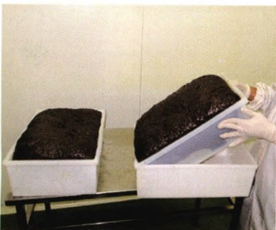
特制的干燥盒取料非常容易