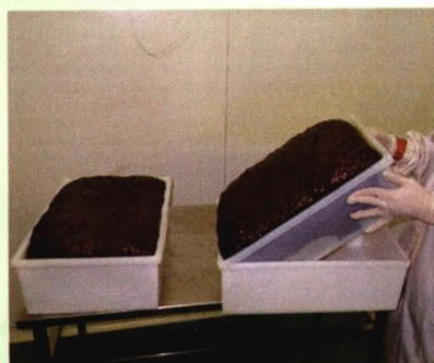
特制的干燥盒取料非常容易