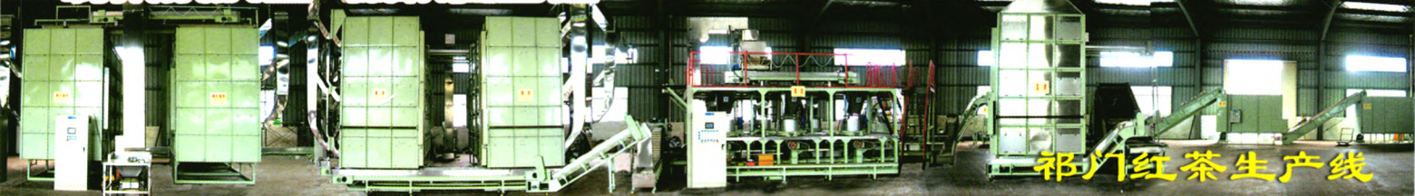
浙江春江茶叶机械有限公司 富阳红茶生产线