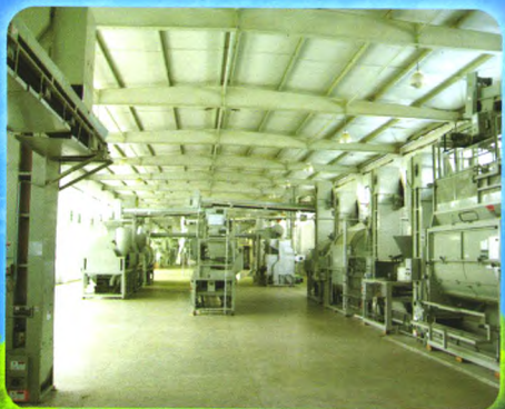
清洁化绿茶、红茶生产流水线