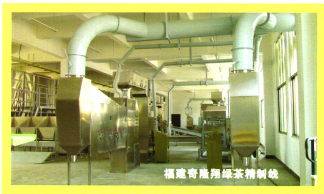
福建奇隆翔绿茶精制线