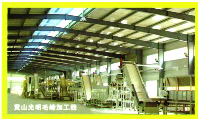
黄山光明毛峰加工线