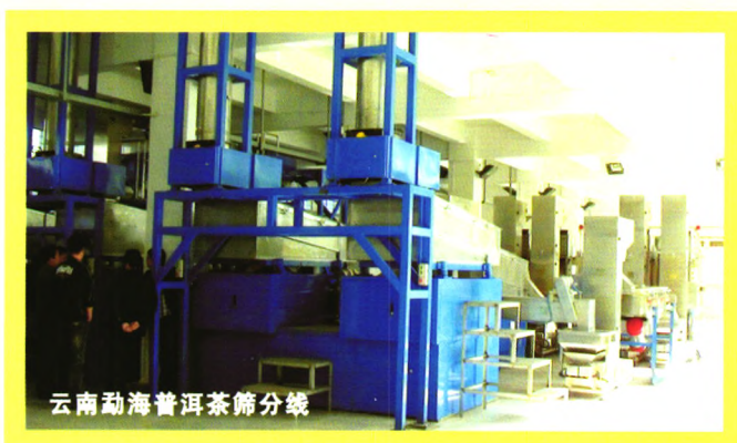
云南勐海普洱茶筛分线