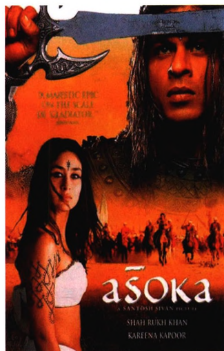
67 新世纪印度电影叙事美学研究