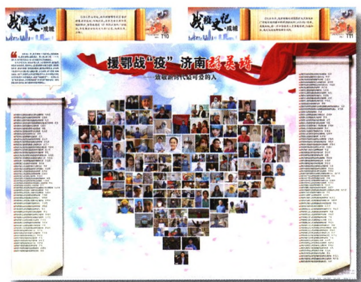
2 ▲ 月度经典版面