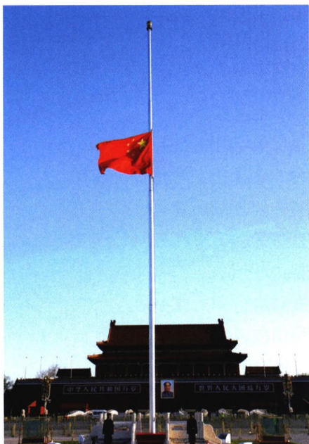
76 ▲ 4月4日，北京天安门广场降下半旗，表达对抗击新冠肺炎疫情斗争牺牲烈士和逝世同胞的深切哀悼