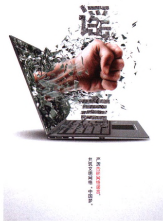
62 从5W模式探析突发事件中的谣言传播