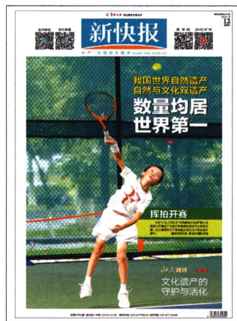
新快报2022年6月12日第一版