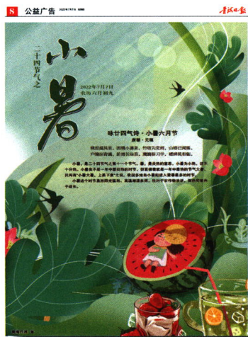
2 ▲ 青海日报2022年7月7日第8版