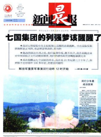
新闻晨报2022年8月5日第1版