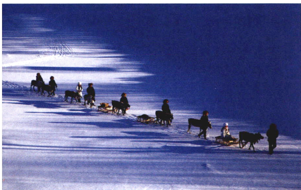
9 拍摄雪景时要巧用白平衡，强化氛围感