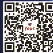
中国报业杂志官方公号