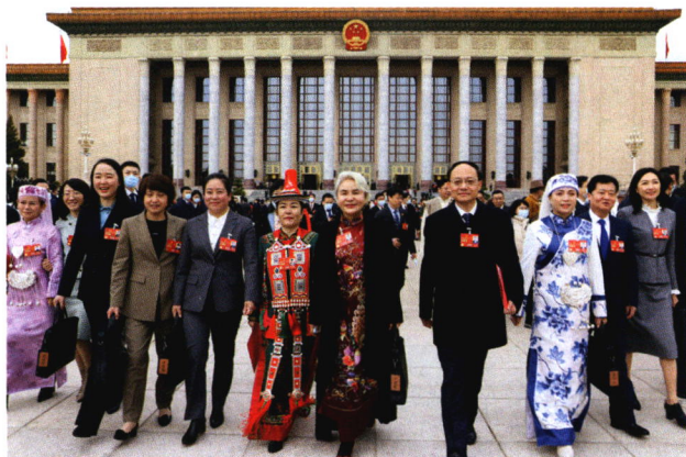
24 ▲ 2023年全国两会在京开幕，新一届代表委员齐聚一堂，共商国是