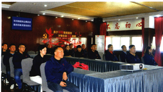
48 中闻集团印刷大讲堂直播正式上线