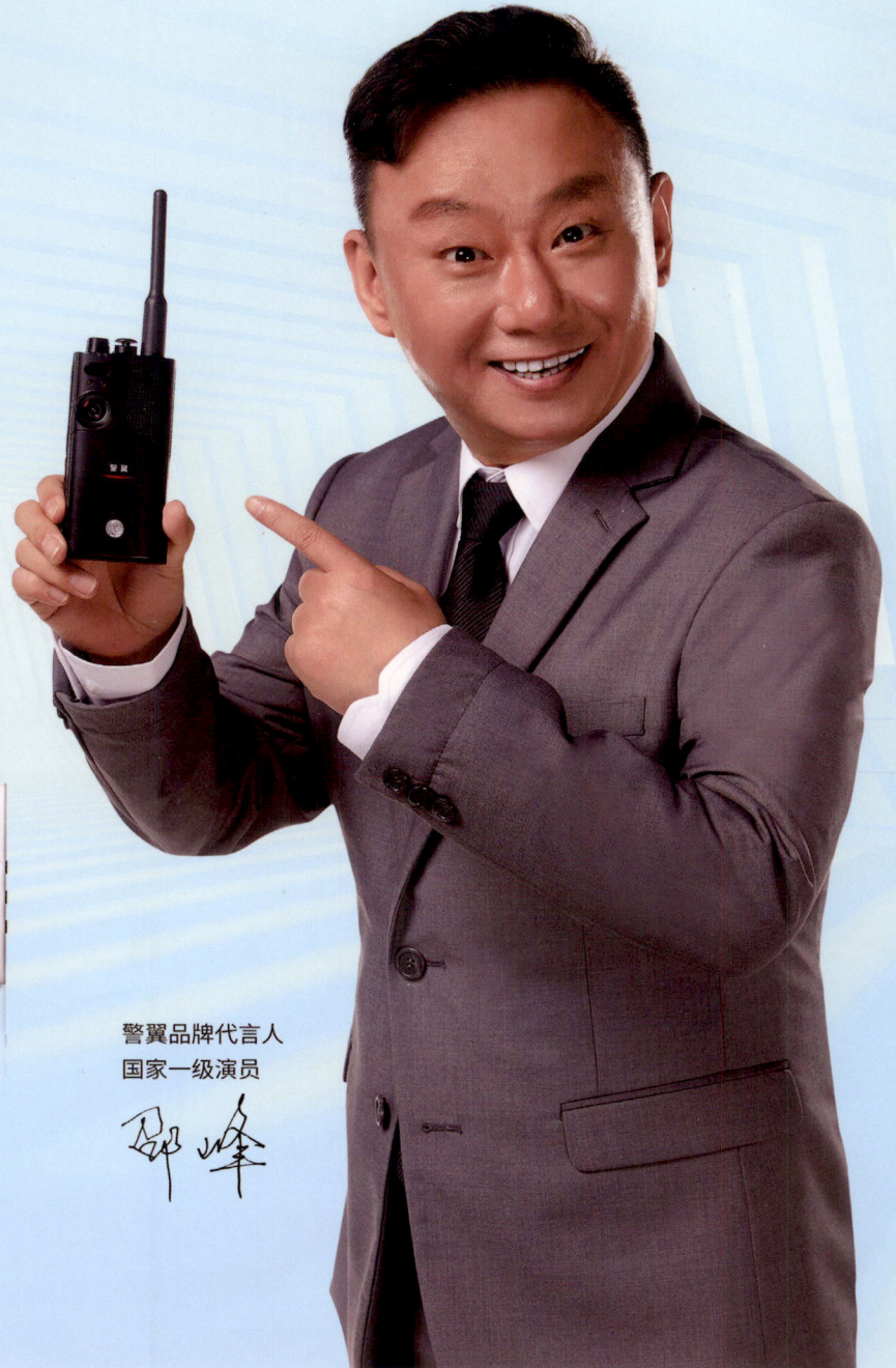
警翼品牌代言人 国家一级演员