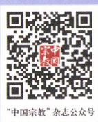
"中国宗教" 杂志公众号

photo.chinareligion.cn 中国宗教图片库 www.chinareligion.cn 中国宗教网