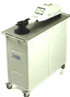
瑞士 FX3300-IV 透气性测试仪