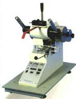
瑞士 FX3750 撕裂强度测试仪