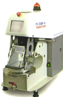
瑞士 FX3000-IV 静压透水性测试仪