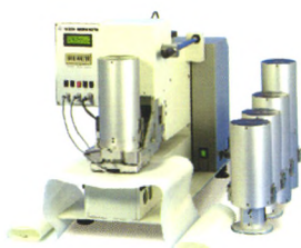
瑞士 FX3350 气囊动态透气性测试仪

25年来，我们不断创新，精益求精，以精确耐用的检查仪器为您长期监查品质 欧美制造，坚固可靠，始终准确无误