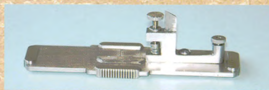
纤维切片机(哈氏切片机)