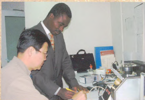
仪器出口国外，技术人员正在给国外人员进行培训