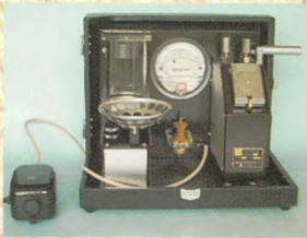
KX175型棉纤维气流仪(马克隆仪)