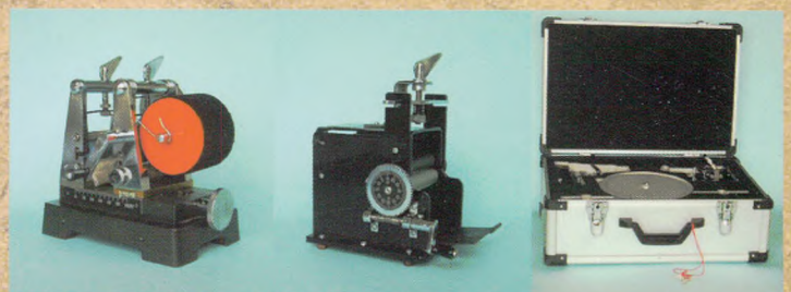
Y111型罗拉式纤维长度分析仪