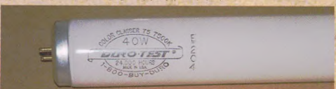
美国DURO-TSET公司生产的D75灯管(美国农业部棉花分级专用灯管)