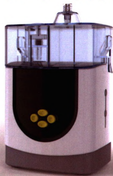
便携式电动引流套装