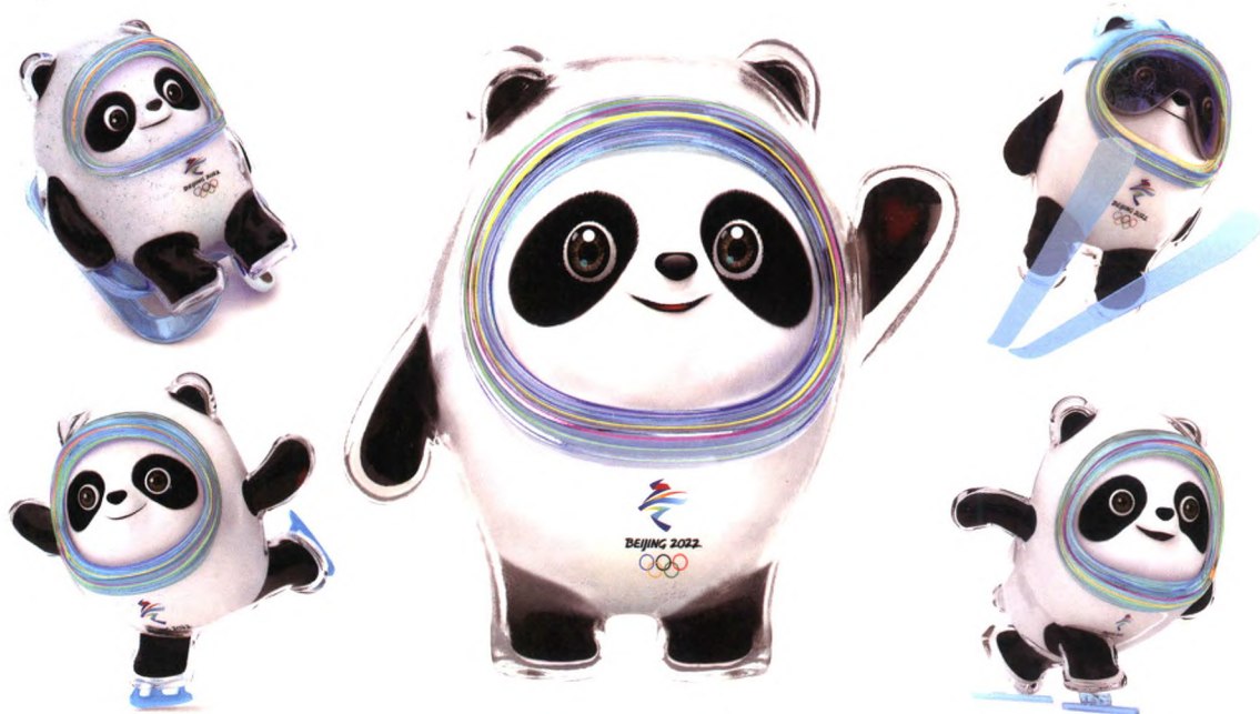
2019年，视觉艺术设计学院团队所设计的2022年冬奥会吉祥物方案“冰墩墩”

视觉艺术设计学院成立于2010年9月，是广州美术学院设计教学建构的重要一环。广美最早的工艺系及之后的装潢、视传、新媒介、数码动漫系等由时间织成的传统，是视觉艺术设计学院最初组建的坚实基础。2018年根据学科发展需要，艺术与科技专业纳入学院。由此，学院在探索与实践逐步打通视觉创意与设计介质之间的藩篱，借助科学技术的高速发展，将与视觉形态相关的专业领域，巧妙地糅合在一起，用创意激活介质，用介质启发或牵引设计，对“视觉艺术设计”做出了全新阐释。