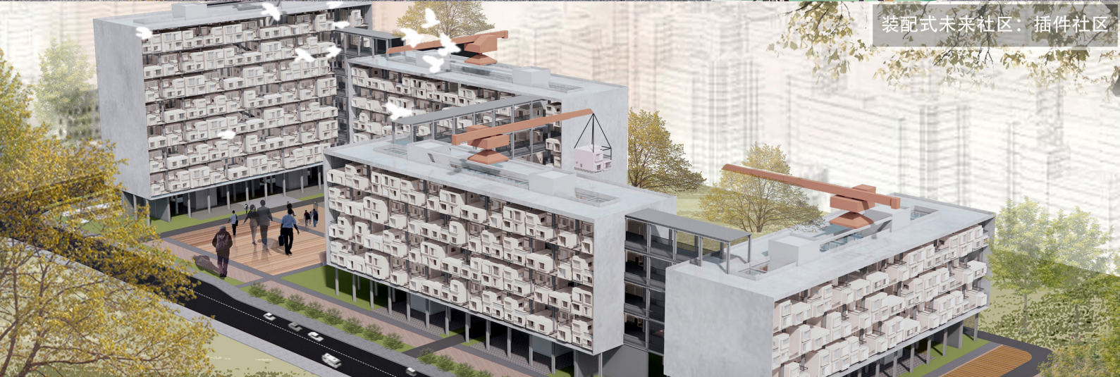
装配式未来社区：插件社区