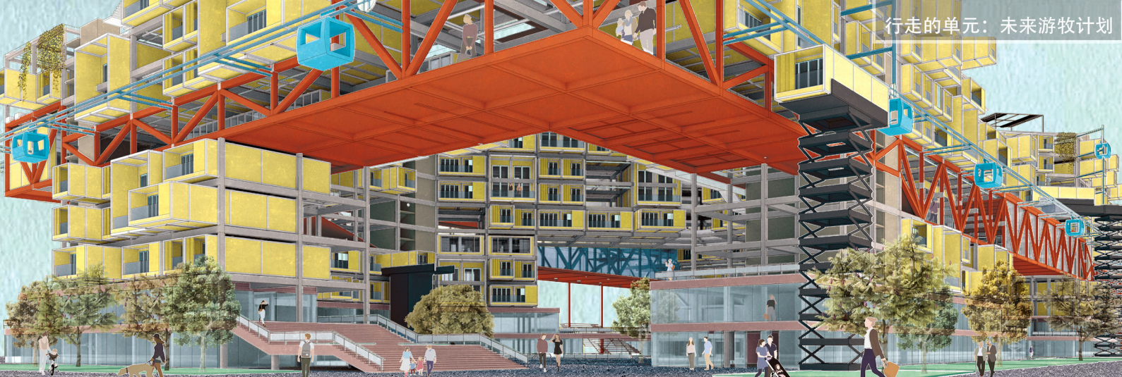
行走的单元：未来游牧计划