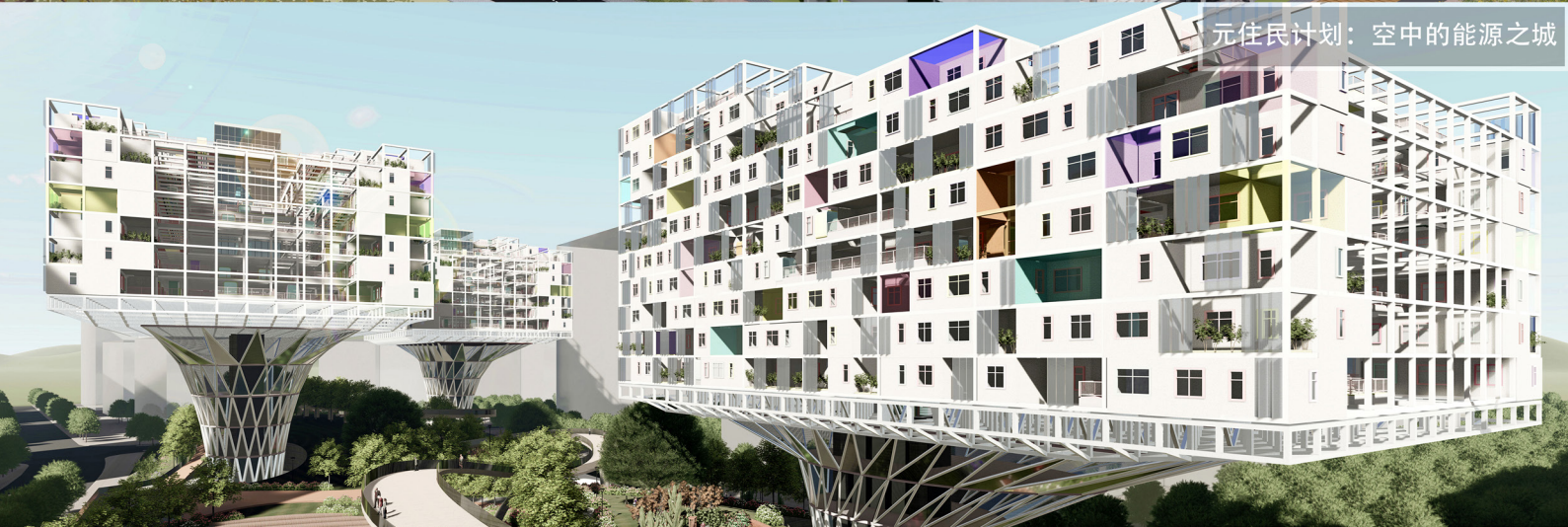
元居民计划：空中的能源之城