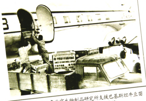
一九五八年北京生物制品研究所支援巴基斯坦牛痘苗 因为往飞机上装运牛痘疫苗