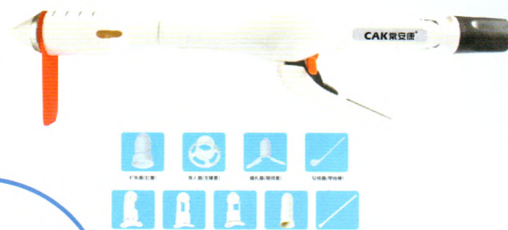
一次性使用肛肠吻合器及其附件（TST）