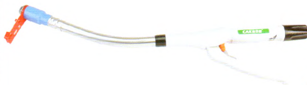
一次性使用管型吻合器