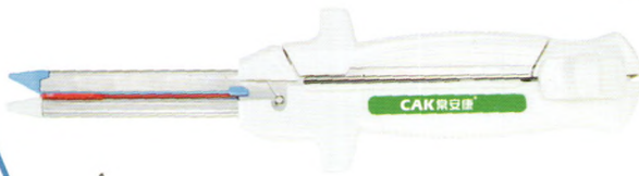
一次性使用直线型切割吻（缝）合器