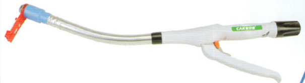
一次性使用管型吻合器