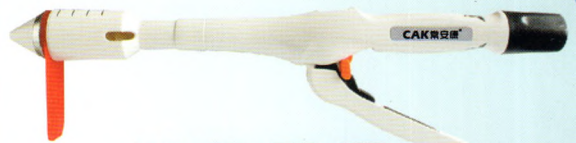
一次性使用肛肠吻合器及其附件（TST）