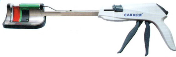
一次性使用弧型切割吻合器