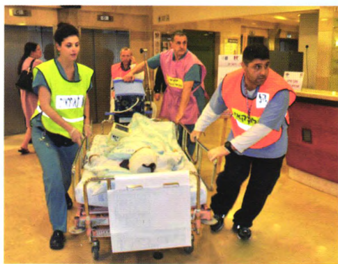
图三 演习中医护人员将病床由拉姆巴姆医院主楼向萨米·奥佛尔地下紧急防御医院转移

在软件方面，地下医院的医护人员大多在军队中服役过，做过军医，去过前线，所以知道在不利条件下怎样工作、在各种情况下怎样救治病人。另外，医院还会定期举行培训和演习来加强医护人员应对紧急情况的能力。