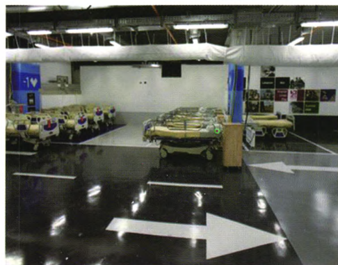
图二 平时为车库，战时为医院

现在地下医院已经准备就绪，配备有独特的过滤器和空调系统可以应对生物和化学战争，为病人提供重症治疗、手术、透析等所需要的一切。在地下医院正式启用之前的特别演习中，医务人员模拟转移一个完整的医疗部门和其他一些科室从医院的主楼到地下设施。同时，还会建立临时的洗手间，淋浴设备和其他必需的设施，以及演练对通风和电力系统的操控。