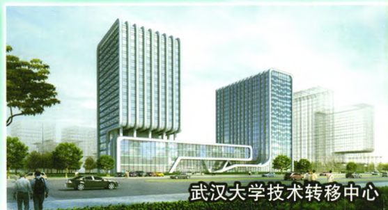
武汉大学技术转移中心