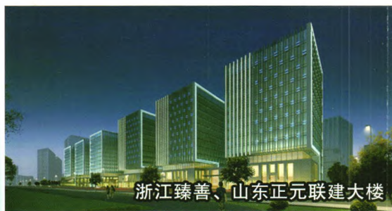
浙江臻善、山东正元联建大楼