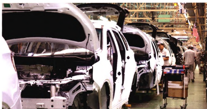
◆ 东风裕隆纳智捷汽车装配流水线

钱塘新区将全面落实省委、省政府“四大建设”决策部署，高效发挥杭州经济技术开发区等国家级平台的带动作用，优化资源配置，强化科技创新，加快转型升级，着力打造世界级智能制造产业集群、长三角地区产城融合发展示范区、全省标志性战略性改革开放大平台、杭州湾数字经济与高端制造融合创新发展引领区。