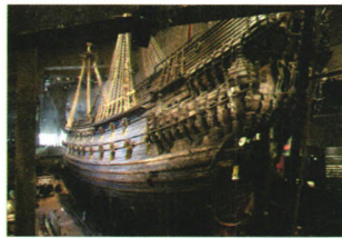
P50 全球沉船博物馆掠影