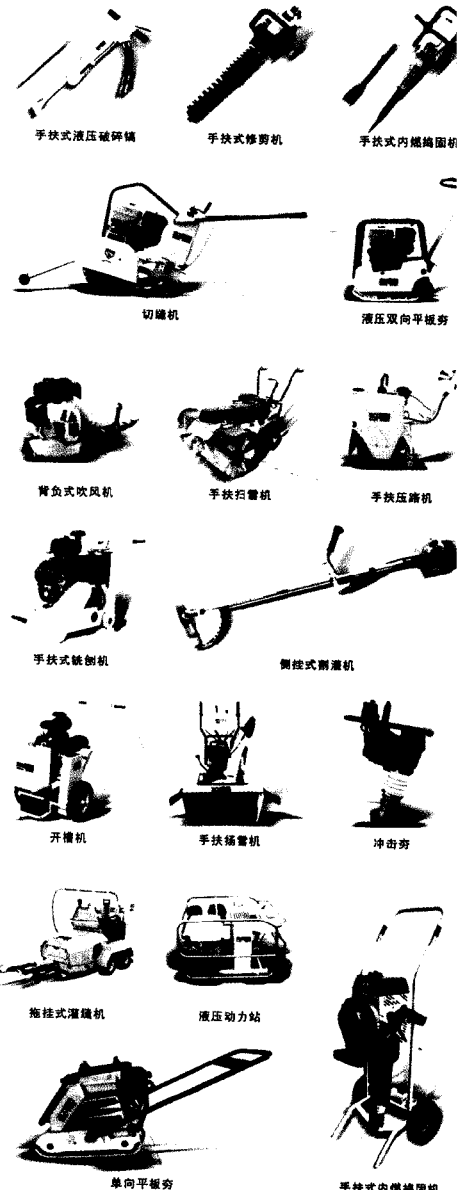
手扶式液压破碎机