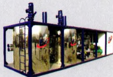
乳化沥青生产设备