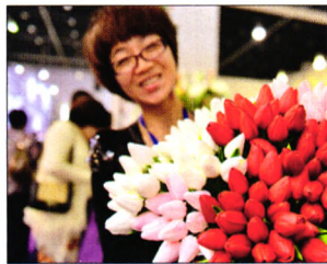
P08 | 速度