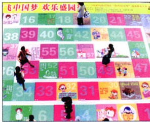
P18 | 宏观

新的少数股东权益却激增，公司部分业务可能出现较大亏损；也有部分投资者认为，公司存在调节利润的嫌疑。