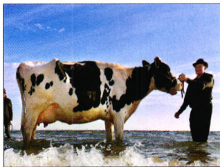
P08 | 速读