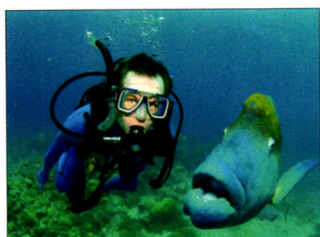
P08 | 速读