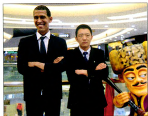
P08 | 速读