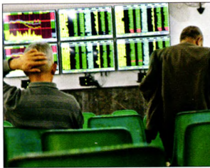
P68 | 金融

涉及金额高达41.9亿元，合作方顺风光电2012年的营业收入不过10亿元，净资产仅5亿元，经营净现金也只有2.4亿元，而其未来10年的年均投资超过70亿元，海润光伏的EPC总承包协议注定不会一帆风顺。