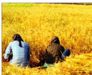
P69 | 海外