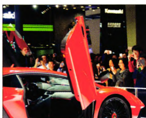
P08 | 速读

四部门联合发文促进融券业务发展给市场带来恐慌, 但监管层出台新政, 并不存在刻意打压股市的意图。在充分考量风险的前提下, 监管层更希望看到融资和融券业务保持适当的平衡。